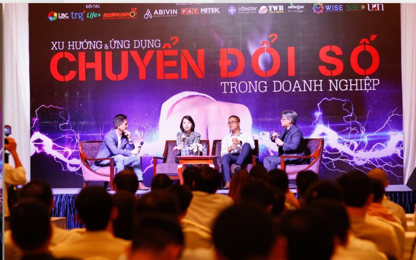
Debate about Digital Transformation